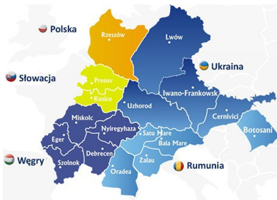
Rys. 1. Mapa Euroregionu Karpackiego