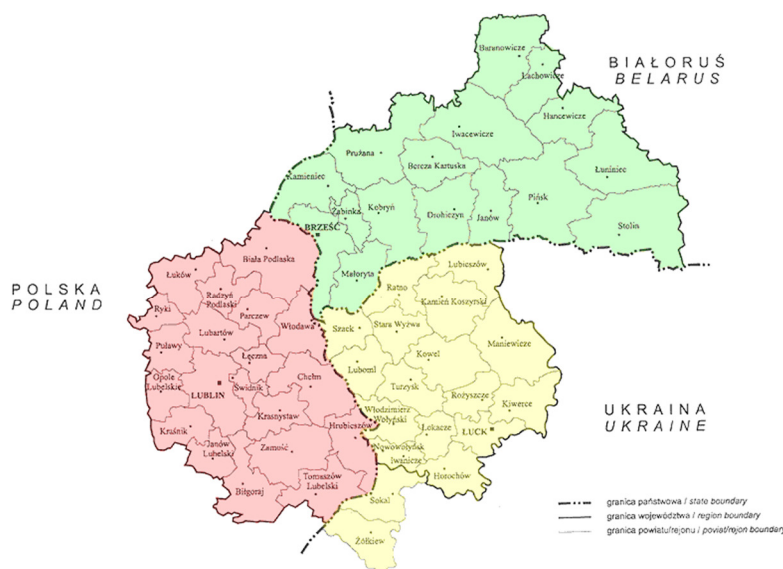
Rys. 2. Mapa Euroregionu Bug

Euroregion Bug zajmuje obszar ponad 90 tys. km 2 w Polsce, Białorusi i Ukrainie. Jego ludność wynosi około 5 mln mieszkańców. Powstał w 1995 roku. Wśród celów Euroregionu możemy wymienić takie, jak: wymiana doświadczeń, organizacja festiwali, koncertów i jarmarków, rozwój przygranicznej infrastruktury, zaopatrzenie w nośniki energii i wodę, ochrona środowiska, intensyfikacja wymiany handlowej, wsparcie rozwoju turystyki i rekreacji, wsparcie sektora małych i średnich przedsiębiorstw, badania naukowe oraz wspólna walka z przestępczością oraz klęskami żywiołowymi.