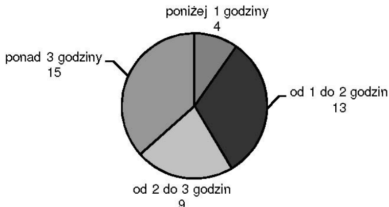
Rys. 1. Dzienny czas wolny do dyspozycji studentów

W zakresie spędzania wolnego czasu, 38 badanych często korzysta z Internetu, 24 badanych sporadycznie zajmują się sportem i turystyką, a 27 badanych nigdy nie modeluje i konstruuje.