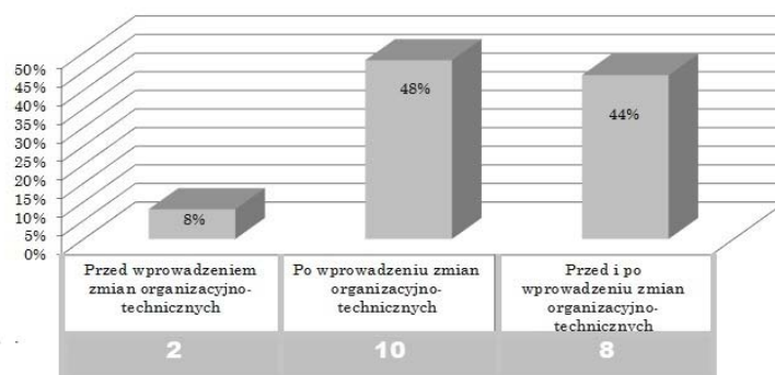
Rys. 1. Kiedy przeprowadzana jest incydentalna ocena ryzyka

Jak widać na wykresie (rys. 1), wśród przebadanych przedsiębiorstw tylko w ośmiu przypadkach odpowiedziano, że ocenę powinno się przeprowadzić przed i po wprowadzeniu zmian. W przypadku dwóch firm odpowiedziano, że przed wprowadzaniem zmian, a przypadku dziesięciu zaznaczono, że incydentalną ocenę ryzyka przeprowadza się po wprowadzeniu zmian.